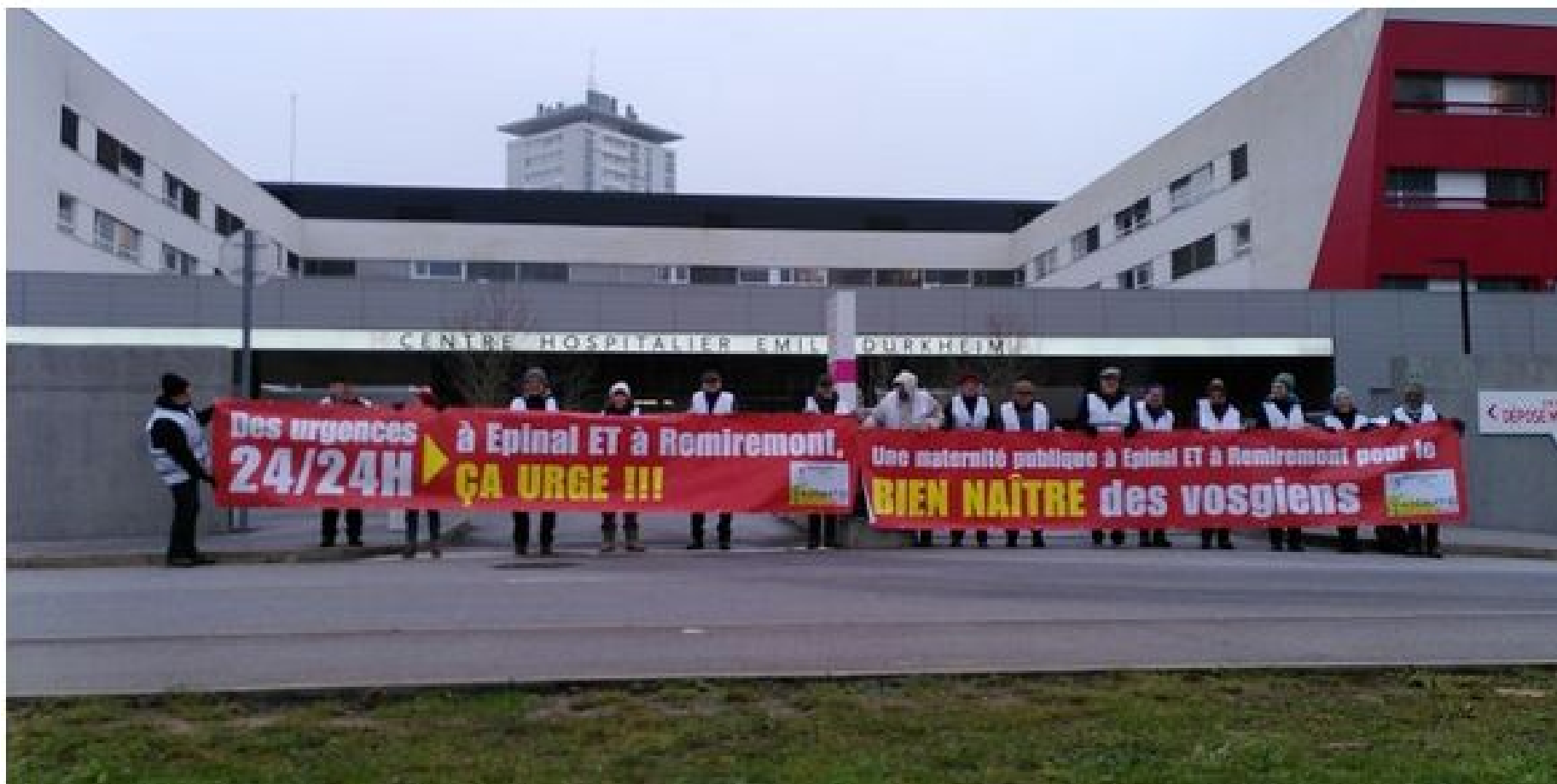
Opération banderoles à Epinal et Remiremont Banderoles enlevées dans la journée