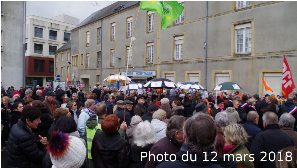
Photo du 12 mars 2018

En accord avec l'intersyndicale des personnels de l'hôpital de Sedan, le comité de défense des hôpitaux de proximité des Ardennes appelle toute la population à descendre dans la rue le 24 mars pour exiger le maintien de tous les services à l'hôpital de Sedan et un budget lui permettant de répondre aux besoins de la population. De plus en plus de communes du secteur portent cette exigence. Des organisations départementales soutiennent le mouvement. Le report des décisions est une première victoire ! Transformons la en un succès durable par notre mobilisation : dans toute la France, des hôpitaux sont en lutte. Le gouvernement doit entendre le besoin des populations à un service public hospitalier de proximité et de qualité et en donner les moyens : la situation sociale du Sedanais en fait une zone prioritaire.