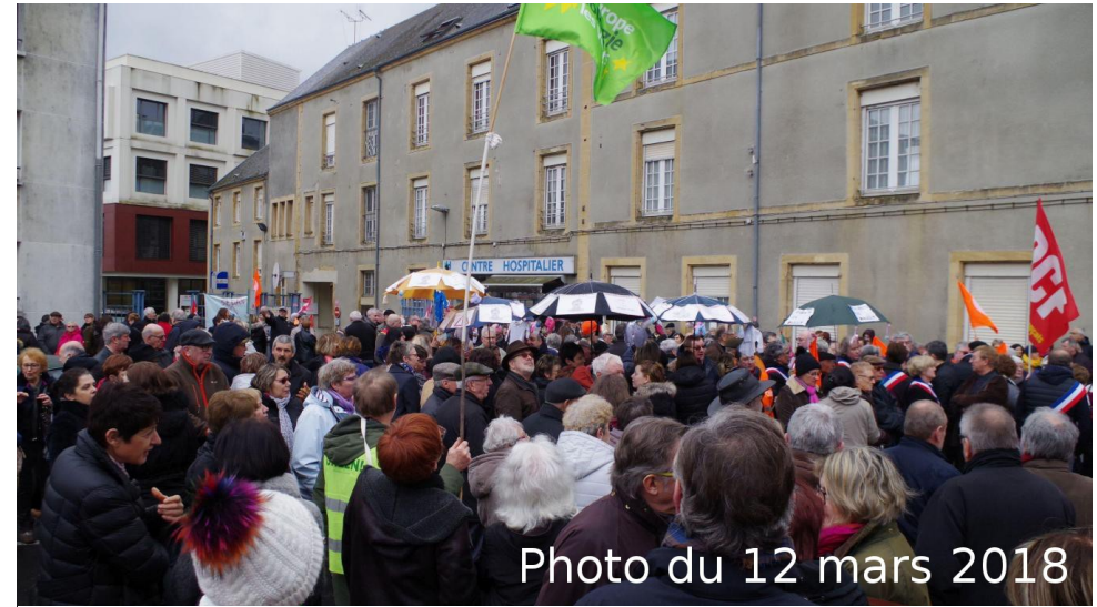
Photo du 12 mars 2018

Facebook : defensehopitauxproximiteardennes