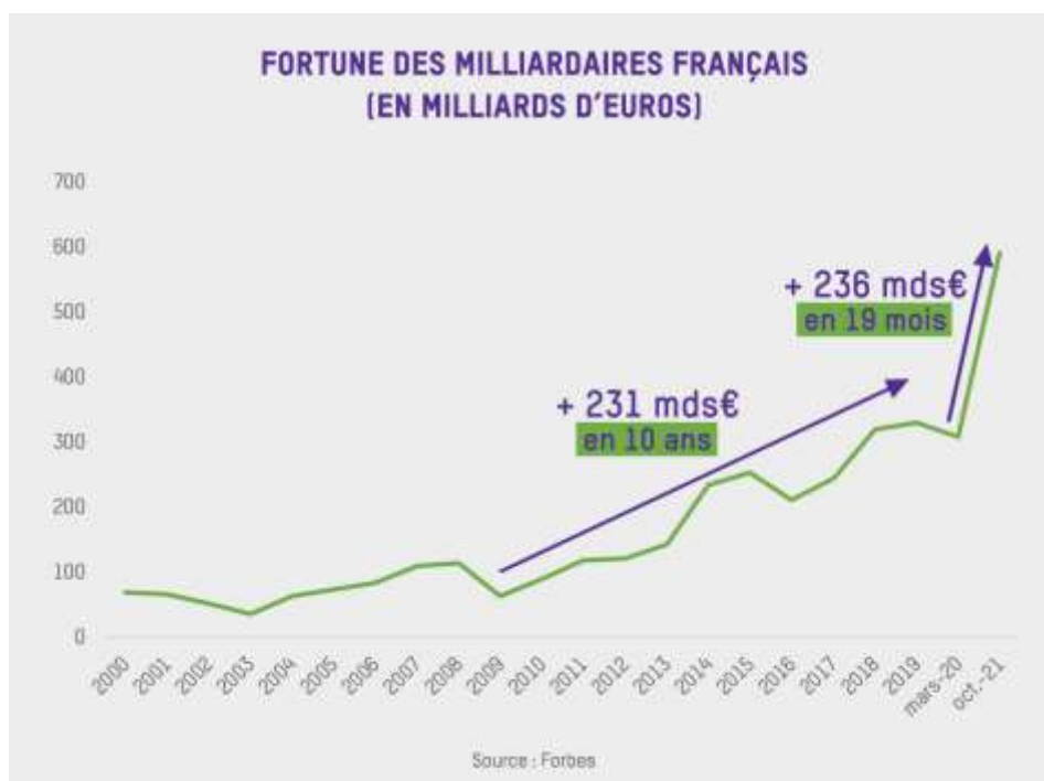
GRAPHIQUE 1 : Evolution de la fortune des milliardaires français depuis 2000

Cette accumulation historique de richesse profite à une poignée de personnes : selon les données Forbes, la France compte actuellement 43 milliardaires, quatre fois plus qu'après la crise financière de 2009. Seulement 5 sont des femmes.