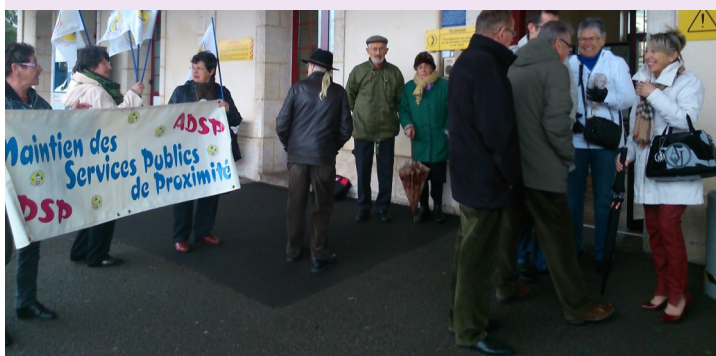
Rassemblement du 19 juin 2015,