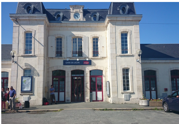
Rassemblement contre le rapport Duron 29 mai 2015

Prochains RDV Les vendredis 26 juin — 3 juillet à 18h. Devant la gare de Luçon