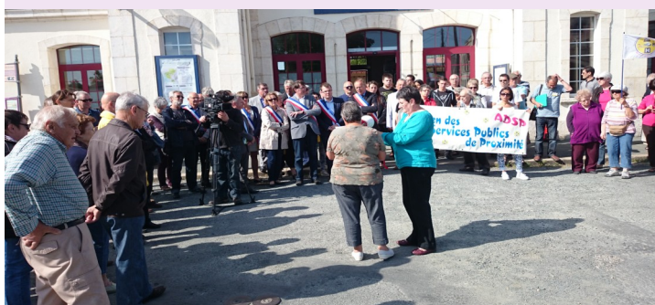
Contre la Loi Macron et le remplacement des trains par des bus -29 janvier 2015